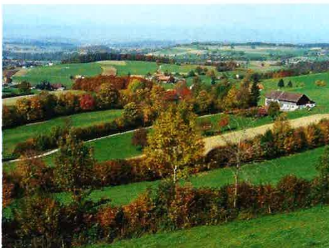
A gauche, allée d'arbres ; à droite, haies