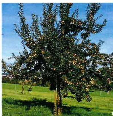
A gauche, verger ; à droite, arbre fruitier haute tige