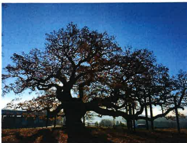
A gauche, arbre isolé ; à droite : arbre remarquable (chêne de Morrens)